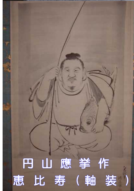
円山應挙作 恵比寿（軸装）