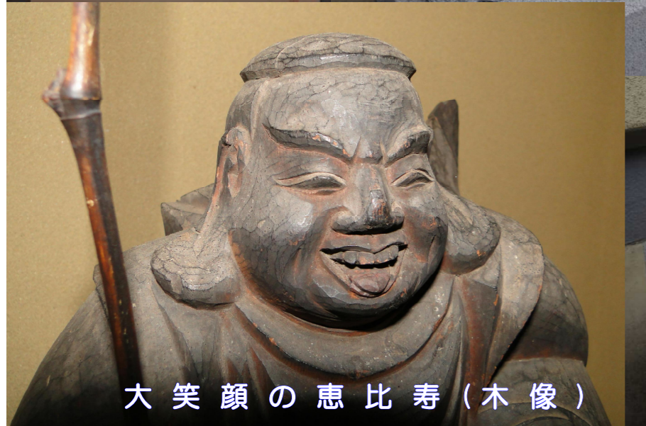
大笑顔の恵比寿（木像）